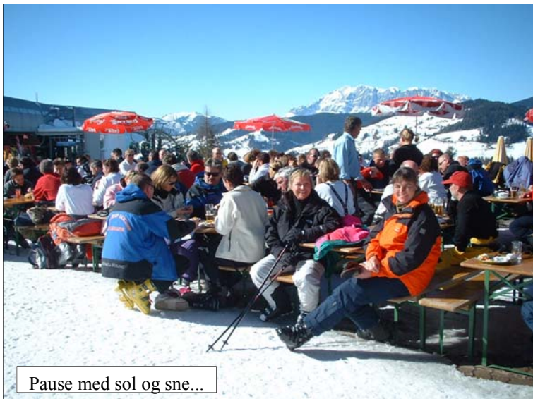
Pause med sol og sne...

kaffe. I skyndingen havde de tilsyneladende brugt kartoffelvandet til at lave kaffe af, for noget af kaffen smagte meget salt.