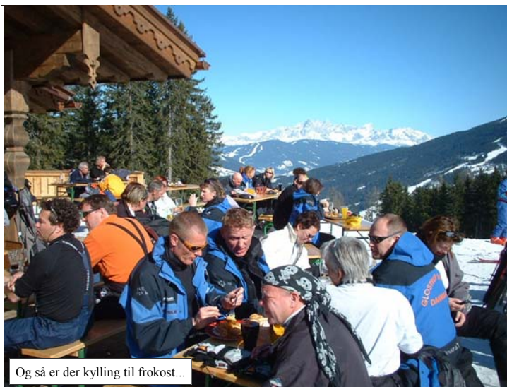
Og så er der kylling til frokost...

Vi blev vækket da vi ankom til Wagrain, hvor vi skulle spise morgenmad. Et meget fint stort morgenbord, men bare for lidt