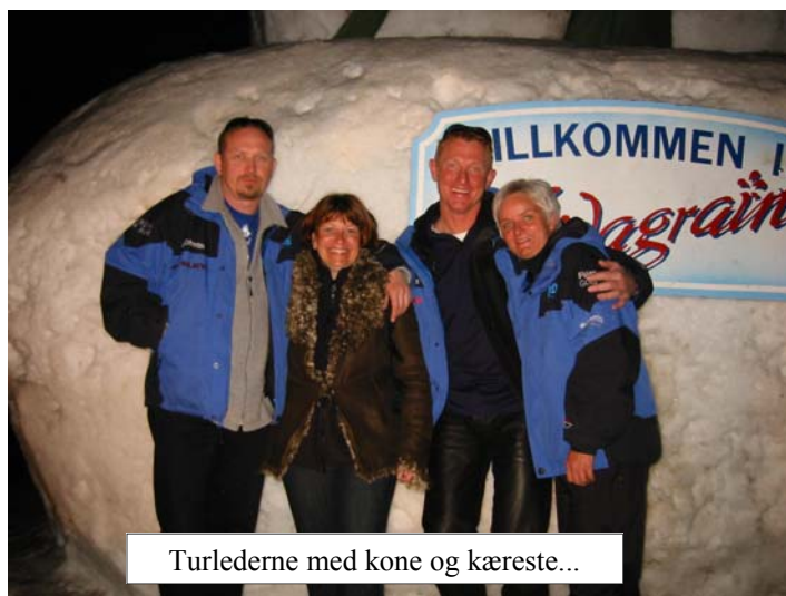
Turlederne med kone og kæreste...

OverBjarne og Boye havde arrangeret fuld solskin hele ugen, så der blev brugt sol-