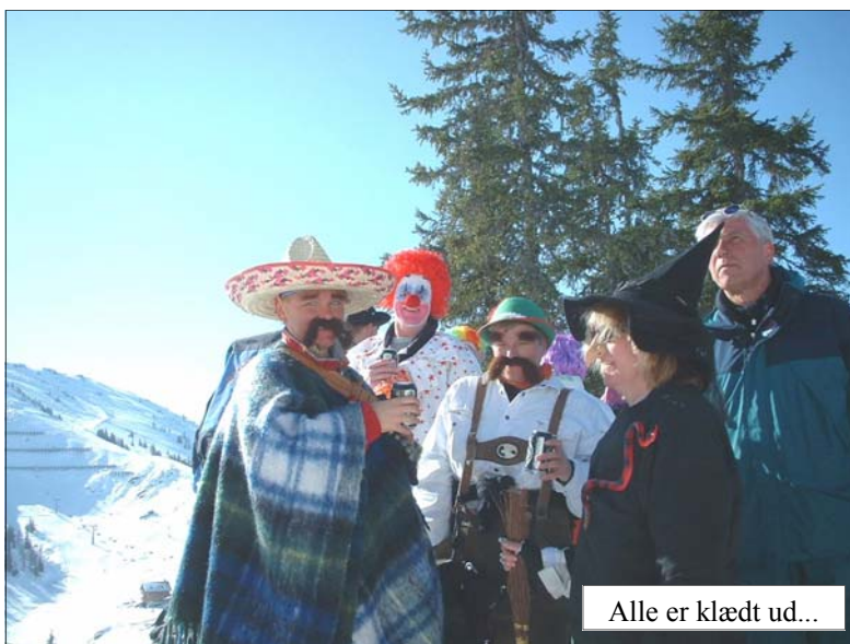
Alle er klædt ud...